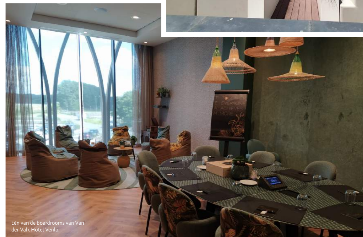
Eén van de boardrooms van Van der Valk Hotel Venlo.