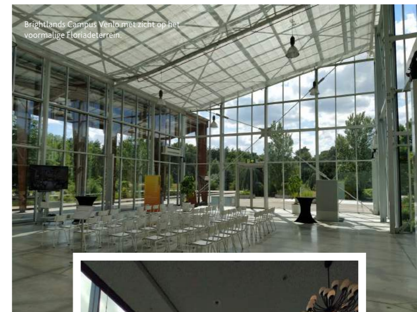
Brightlands Campus Venlo met zicht op het voormalige Floriadeterrein.