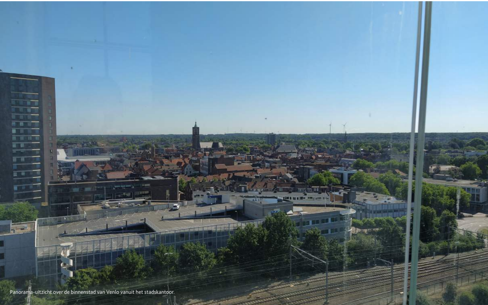
Panorama-uitzicht over de binnenstad van Venlo vanuit het stadskantoor.