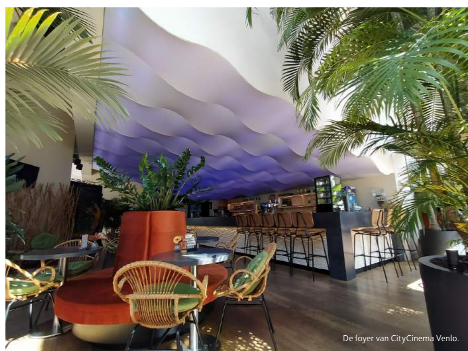
De foyer van CityCinema Venlo.

doordeweeks te huur voor brainstormsessies en workshops. Voor het organiseren van zakelijke events werkt Grenswerk ook veel samen met het naastgelegen De Maaspoort Theater & Events.