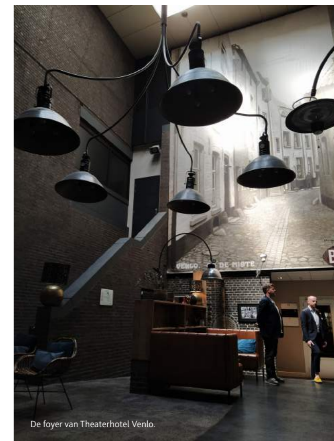
De foyer van Theaterhotel Venlo.