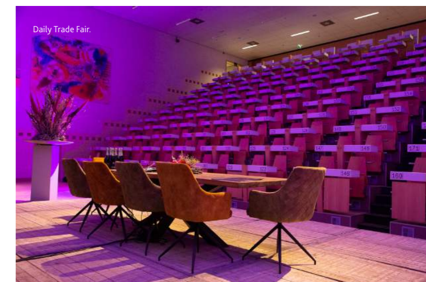
Daily Trade Fair.

Na een programma vol bijzondere en duurzame locaties komt de eerste locatietour van Venlo Convention Bureau ten einde. Om de duurzaamheidsboodschap extra kracht bij te zetten, krijgen de deelnemers een mini-fruitboom cadeau om de CO 2 -voetafdruk van hun reis te compenseren. Dat Venlo zich met de recht de duurzaamste congresbestemming van Nederland mag noemen, mag duidelijk zijn!