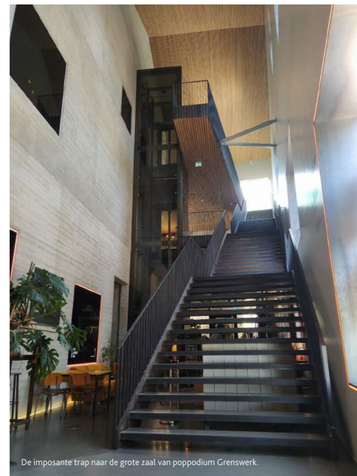
De imposante trap naar de grote zaal van poppodium Grenswerk.

De volgende locatie op het programma is Daily Trade Fair Events. Deze voormalige bloemenveiling opent dit najaar de deuren als permanente showroom (15.000 m 2 ) voor inkopers en eigenaren van bedrijven in de hospitality-, home-, gift- en gardenbranche. Het initiatief komt van de ondernemers van de naastgelegen groothandel FloraZON en diverse interieurbedrijven, die naast het cash & carry inkoopcentrum en de interieurgroothandels een tweede manier zochten om hun producten in grotere hoeveelheden te kunnen aanbieden. Meeting- en eventplanners kunnen hier nu al terecht voor bijvoorbeeld een vergadering of presentatie in de afmijnzaal. Hier zijn nog altijd de 312 kopersbankjes, de glazen ruimtes