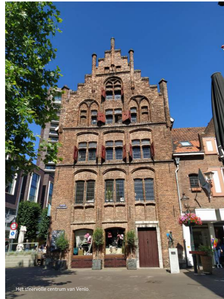
Het sfeervolle centrum van Venlo.

In het gebouw zijn diverse duurzame materialen gebruikt. Een warmtepomp en een groene wand zorgen voor een natuurlijke klimaatbeheersing en luchtcirculatie. Het stadskantoor is mede dankzij de goede luchtkwaliteit een bijzonder prettige werkplek en trekt per jaar 30.000 internationale bezoekers