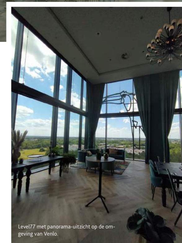
Level77 met panorama-uitzicht op de omgeving van Venlo.

voeding, future farming en biocirculaire economie. De evenementenhal biedt zicht op het Floriadepark van 60 hectare. Hier kunnen evenementen, diners en presentaties worden gehouden. Daarnaast is er nog een grote (college)zaal, enkele kleine zalen en een uitgebreide keuken waar kookworkshops kunnen plaatsvinden. Op 500 meter afstand van Villa Flora ligt de Innovatoren, waar je op de bovenste verdieping diverse vergaderzalen kunt huren. Het uitzicht over het Floriadeterrein krijg je er gratis bij. In het park zelf kun je ook nog gebruik maken van de theaterheuvel.